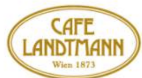
Abbildung: Haupt-Kooperationspartner von Riding Dinner.