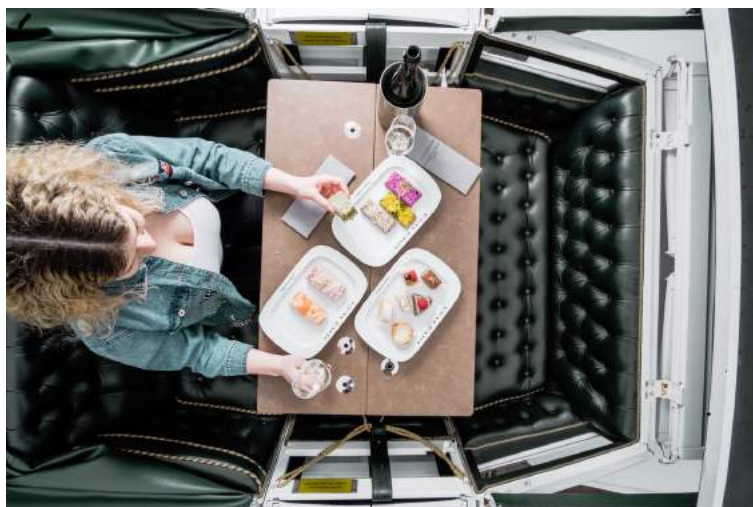
Abbildung: Sparkling Sightseeing.