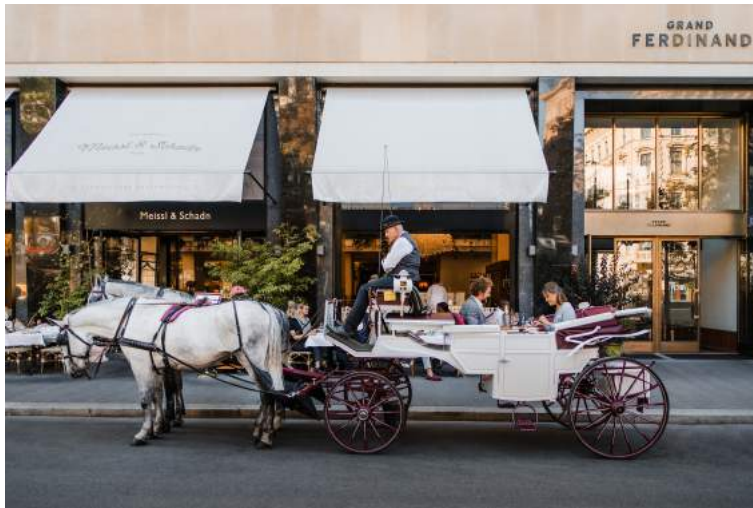
Abbildung: Riding Schnitzel Tour.