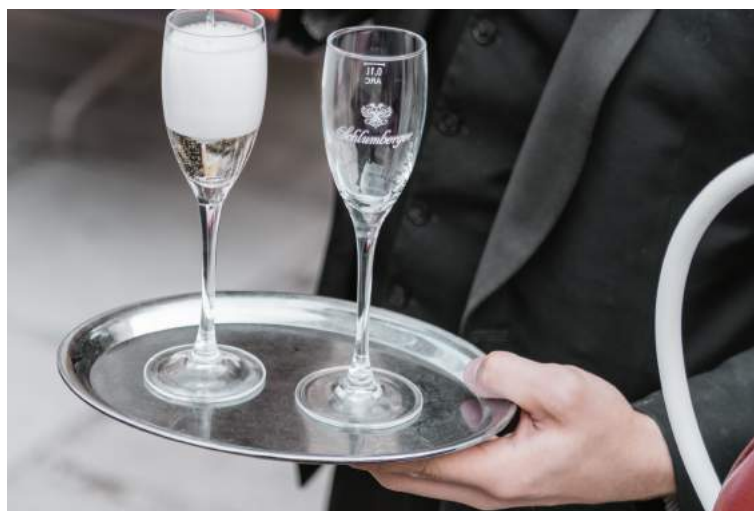
Abbildung: Aperitif Service – Riding Dinner.

Bitte beachten Sie, dass dieser Service erst ab 16 Personen/4 Kutschen bis maximal 80 Personen/ 20 Kutschen zeitgleich gebucht werden können.