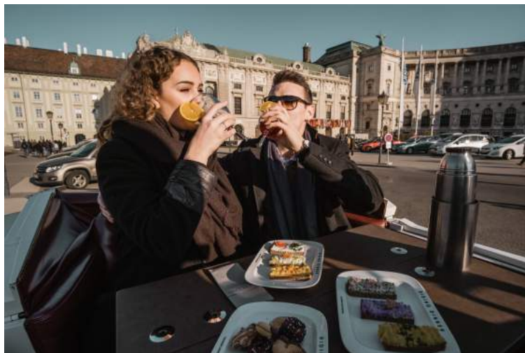
Abbildung: Tea Time & Coffee Break.