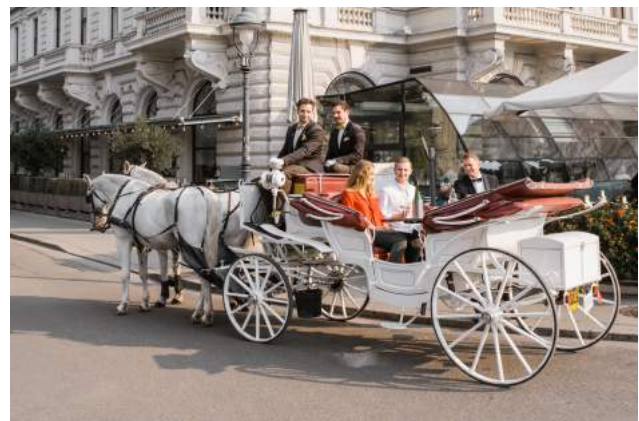
Abbildung: komfortabel getrunken & gespeist wird während der Fahrt in unserem rollenden Restaurant.