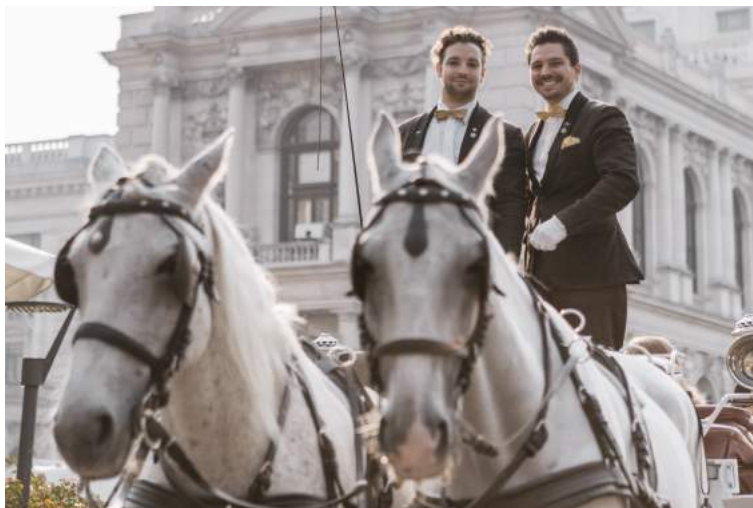
Abbildung: Wir freuen uns Ihr Wien Erlebnis sein zu dürfen.

Telefon: + 43 676 66 04 980 Email: r.novotny@ridingdinner.com