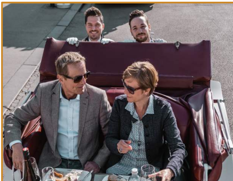
Abbildung: Wir vereinen Genuss & Erlebnis für alle Sinne.

Telefon: + 43 676 66 04 980 Email: r.novotny@ridingdinner.com