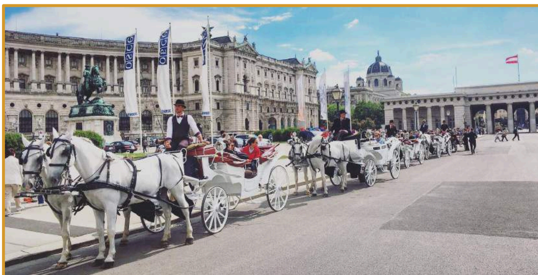
Abbildung: Discover Vienna für 20 Personen – Zwischenstopp Heldenplatz.