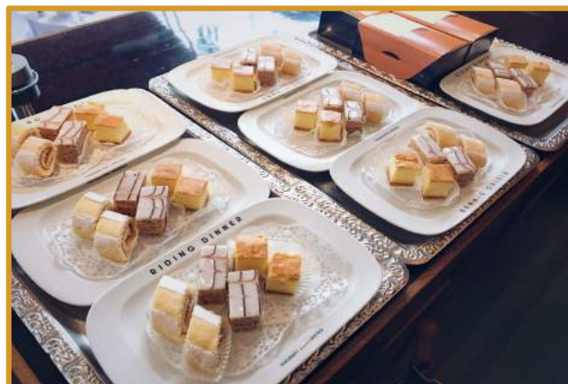
Abbildung: Tea Time & Coffee Break