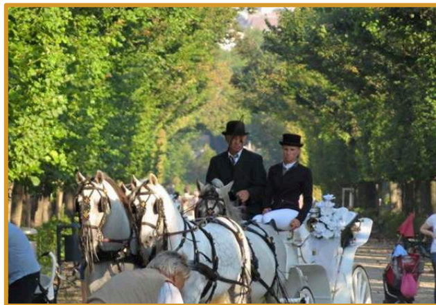
Abbildung: Apfelstrudelshow & Fiaker im Schlosspark Schönbrunn