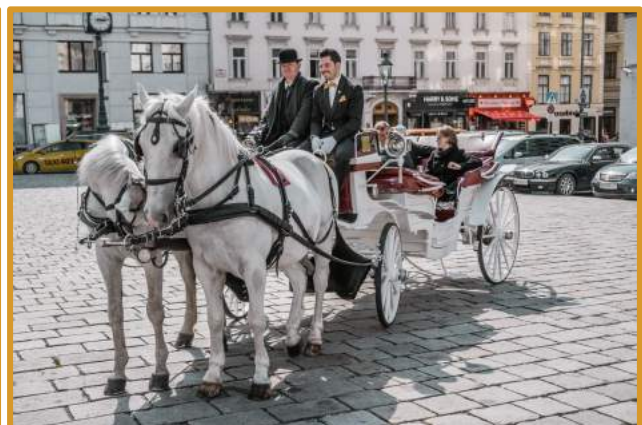
Abbildung: komfortabel getrunken & gespeist wird während der Fahrt in unserem rollenden Restaurant.