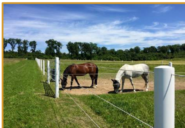
Abbildung: Fiaker-Pferde-Zentrum in Arbesthal