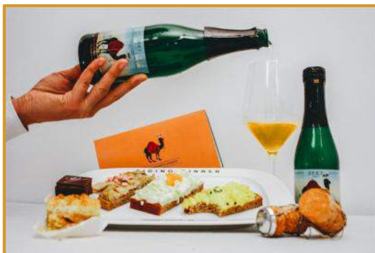
Abbildung: Wiener Genussbox – Riding Dinner

Bitte beachten Sie, dass das Paket nur ab einer Mindestteilnehmerzahl von 9-12 Personen bzw. 3 Kutschen bis maximal 80 Personen bzw. 20 Kutschen zeitgleich gebucht werden können.